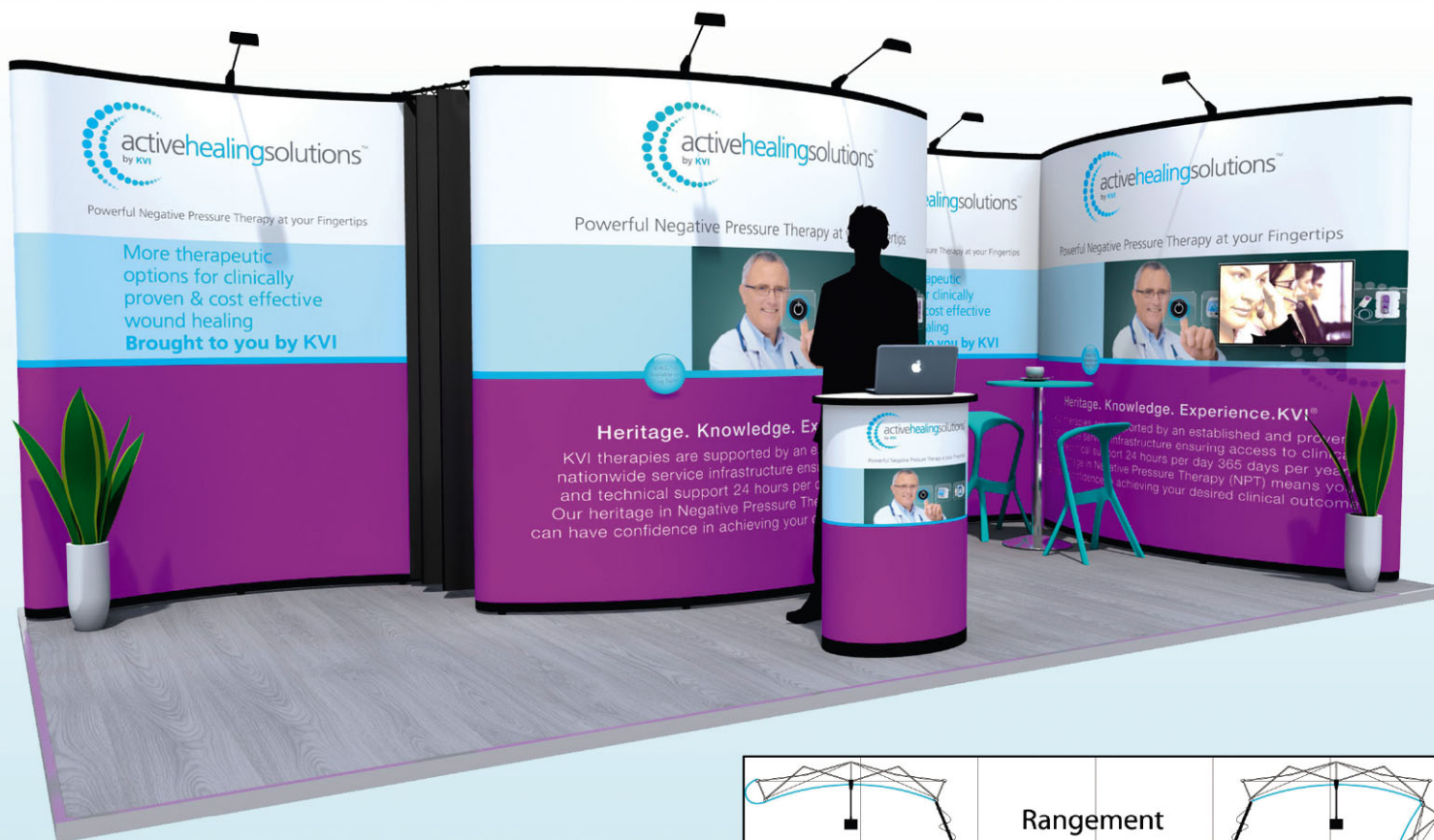
Stand d'angle 6 x 3 m